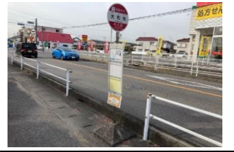
青802 東本郷9組ごみステ 青812 大神社前 黄822 ライオンズマンション西岡崎 青832 石工団地協同組合ごみステ 黄842 筒針(南向き)バス停