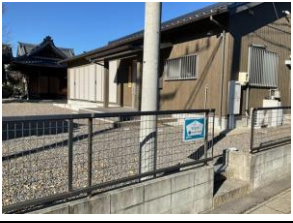
青801 東本郷町公民館前 青811 渡下公民館 青821 角田ごみステ 青831 にしおかざきクリニック 黄841 大和町(南向き)バス停