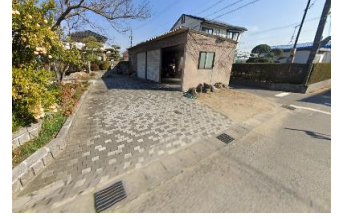
青806 筒針町寺前ST 青816 東牧内栄屋乳業西 黄826 白鳥こども広場ごみステ 黄836 島(北向き)バス停