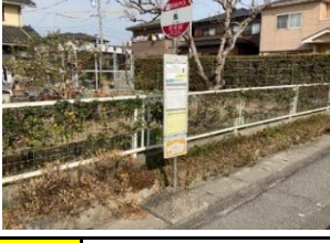
黄807 筒針町川田公園ST 青817 肥後原団地入口ごみステ 青827 桑子児童遊園前 黄837 小望(北向き)バス停