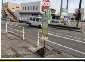
青810 渡上町公民館 黄820 丸岩工業 青830 金魚苑横ごみステ 黄840 大和町(北向き)バス停