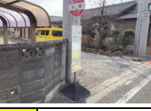
青809 アネックス渡 青819 下佐々木町公民館横 青829 新堀町神社入口 黄839 牧内(北向き)バス停