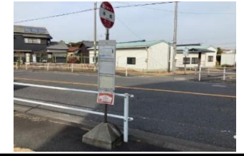
青805 筒針町公民館東ST 青815 東牧内3組ごみステ 青825 大和町公民館 黄835 坂戸(北向き)バス停 青845 東島郷東