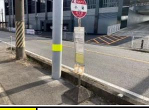
青808 渡町公園 青818 上佐々木町公民館 青828 光善寺 黄838 小望(南向き)バス停