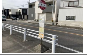
黄803 筒針町寺内ごみST 青813 東牧内7組ごみステ 黄823 島坂町公民館前 黄833 鹿乗川横の不燃ごみステ 黄843 北筒針(北向き)バス停