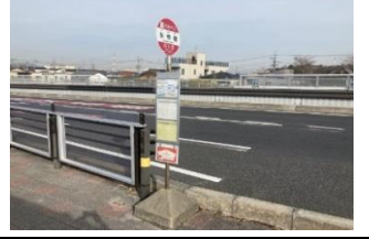
黄402 矢中西 赤412 五区11号線北の西 青422 東小学校西 青432 カミヤ医院北 赤442 矢作橋(東向き)バス停