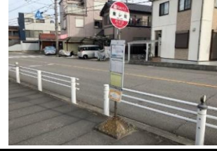
黄404 矢中東 黄414 赤から駐車場南 青424 キングスコート前 黄434 東レ前(南向き)バス停