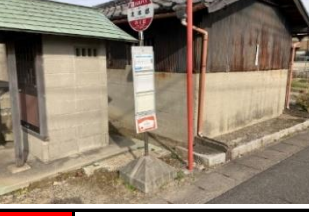
青409 五区13号線南 黄419 矢作市営住宅西 青429 八剣社 赤439 矢作学校前(西向き)バス停