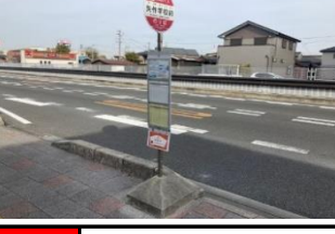
青410 中村接骨院 赤420 矢作市民ホーム前 青430 Vドラック矢作東 赤440 矢作学校前(東向き)バス停