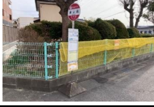
赤405 北本郷野添GS 黄415 矢作児童遊園 赤425 勝蓮寺南 黄435 矢作口(西向き)バス停