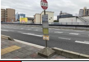
黄407 五区8号線南 黄417 四区公民館前 赤427 オチアイ駐車場前 赤437 北本郷(南向き)バス停