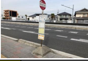
赤406 北本郷ベルGS 黄416 岡信矢作北 赤426 矢作郵便局東 黄436 矢作口(東向き)バス停