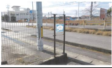
青401 水上眼科耳鼻科 赤411 五区13号線北 青421 金谷ポンプ場東 黄431 橋塚こども広場 赤441 矢作橋(西向き)バス停